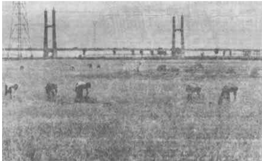
我市夏收工作已全部展开。图为垦利县农民在收割小麦。

加快工业技术改造步伐，为企业改造输入新的“血液”。自84年来，共投资8220万元用于技术改造与新产品开发，这些项目已陆续发挥效益。县播种机厂新开发的抽油机项目在油田打开销路，11.5万吨乙烯配套、盐田配套