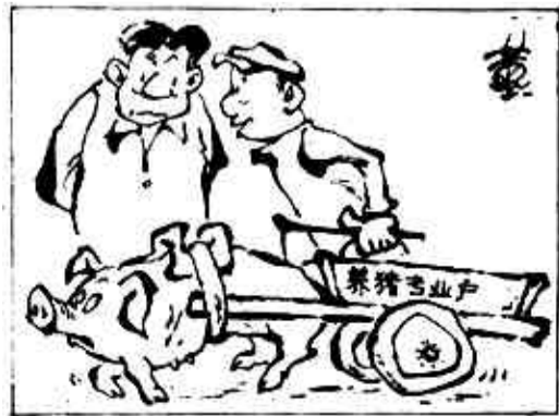
听说现在搞运输能赚大钱.....