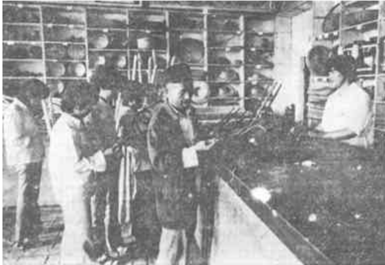
垦利县胜坨乡供销社积极为农民提供“三夏”农用物资，不失时机地支援农业生产。图为农民在选购农具。